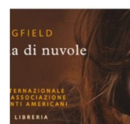
Chi leggerà Una mano piena di nuvole?