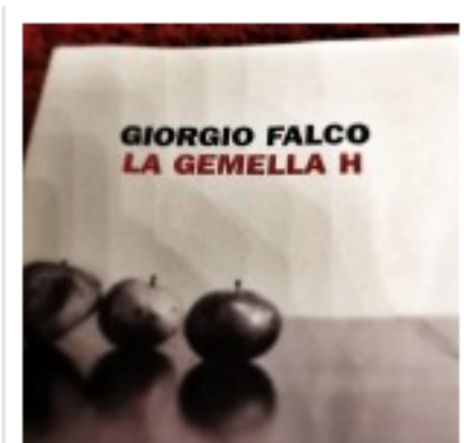
La Gemella H di Giorgio Falco