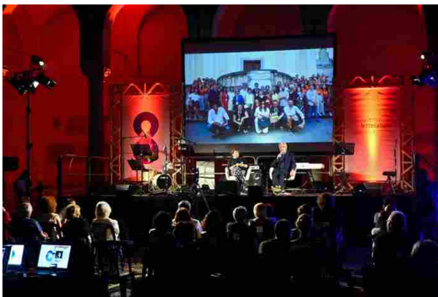
Fotografia d'autore. Salerno. Italia

Dal 17 al 24 giugno si terrà l'undicesima edizione di Salerno Letteratura . Saranno oltre centosessanta gli ospiti, italiani e internazionali, che animeranno il centro storico