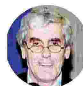
A sinistra la copertina del suo libro "Gustav Mahler e l'incontro mistico di poesia e musica" in alto una sua foto

particolare il versante del rapporto romano-germanico e quello romano-celtico. In tale settore, una significativa per quanto parziale esemplificazione la si trova nel volume 'Romanobarbarica. Scritti scelti', edito da Sismel nel 2017. I vertici delle sue ricerche in tale ambito sono i volumi 'Storia culturale dei rapporti tra mondo romano e mondo germanico' pubblicato da Herder nel 1992, per il quale ha ricevuto in Campidoglio il 'Praemium Urbis', e 'La formazione della cultura europea occidentale, sempre per i tipi della