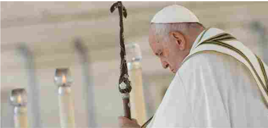
Papa Francesco

È diventato un libro per i tipi di Marcianum Presse l'esperienza del consultorio "Al Quadraro" di Roma, un progetto pilota della diocesi che compie 30 anni