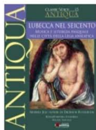
Classic Antiqua 15 - Lubecca nel Seicento