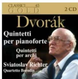
Classic Gold 45 - Dvorák