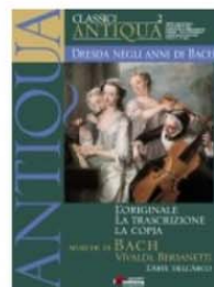
Antiqua Digital 02 - Dresda negli anni di Bach