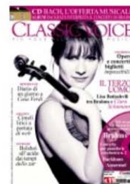
Abbonamenti Classic Voice - 1 anno - Italia