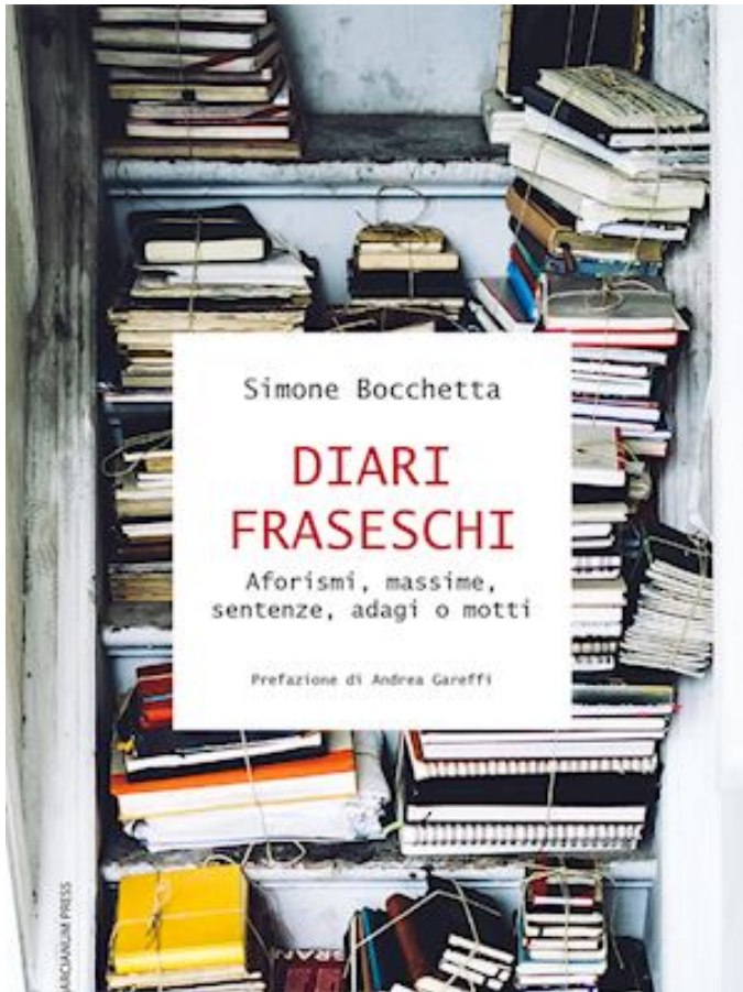
Diari fraseschi. Aforismi, massime, sentenze, adagi o motti