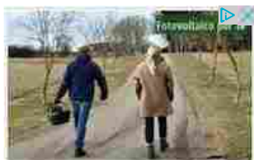
Prima di mettere il fotovoltaico a casa, leggi queste 3 novità che stanno cambiando il mercato