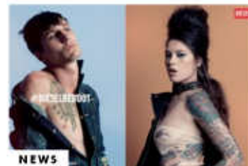
NEWS di Ilaria Chiavacci Diesel: parola d'ordine: creatività