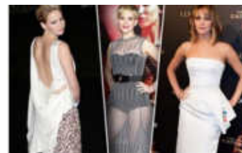
di Federico Rocca Jennifer loves Dior