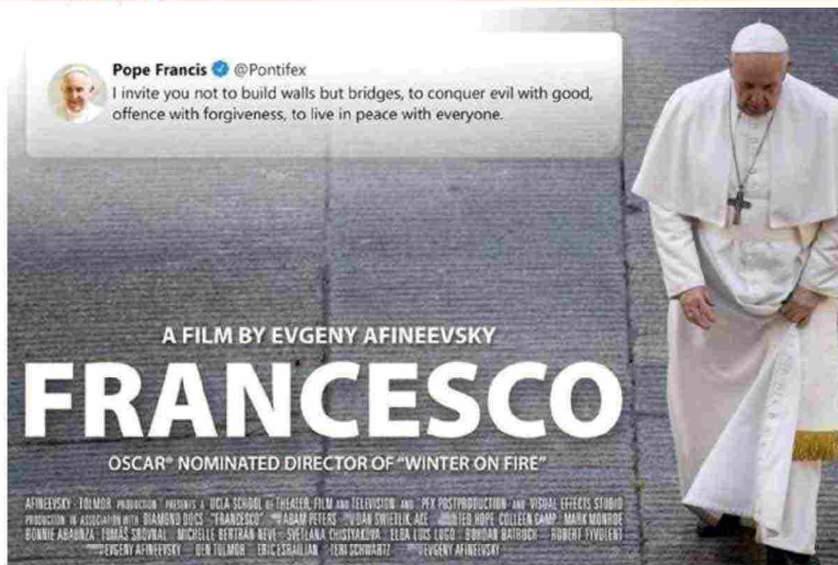
Locandina Film - Documentario

"Gli omosessuali sono figli di Dio e hanno diritto a una famiglia. Nessuno dovrebbe essere estromesso o reso infelice per questo"; lo dice il Pontefice in un docufilm presentato al Festival di Roma