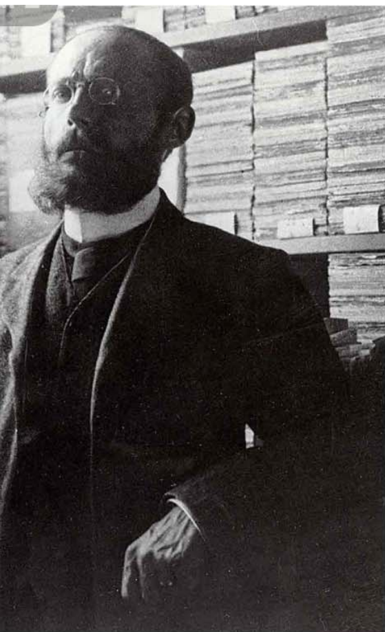
In queste foto, Paul Claudel (a sinistra) e Charles Péguy. In un libro edito da Marcianum Press è ora pubblicato anche in Italia il dialogo a distanza tra i due