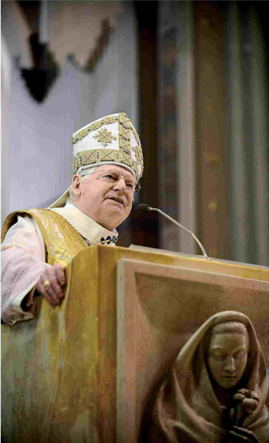
Angelo Scola è cardinale dal 2003 e arcivescovo di Milano dal 2011

pensavo (e penso) che siano battaglie perse. L'aborto, la fecondazione assistita, la prospettiva della clonazione, sono pratiche che mi atterriscono ma che si sono già imposte. Non c'è niente da fare. Non so se siano la premessa della devastazione dell'umanità, ma so che indietro non si torna, non si è mai tornati. Bisogna farci i conti. Ed è sulle pagine impegnate dal cardinale Scola su questi temi che mi sono sentito fatto fuori.