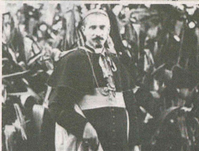
Uno stralcio tratto dai tre documenti scoperti tra i 66 faldoni relativi al cardinale Celso Costantini, di cui nell'ottobre 2017 è stato aperto il processo di beatificazione. Scrive a Papa Pio XII in seguito alle loro frequenti udienze private prospettando, come avrebbe fatto Papa Francesco, una Chiesa aperta al mondo, missionaria e molto meno curiale e romana