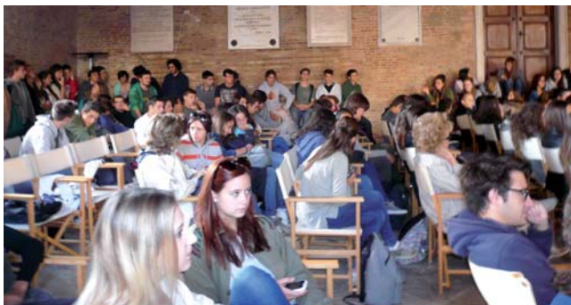
A sinistra: Roberto Saviano. Qui sopra e a destra: l'apertura del Festival con i ragazzi del liceo cittadino Leopardi-Majorana e Gianmario Villalta

fano Piedimonte per un repertorio di "storie vere ma incredibili, che nessuna fantasia riuscirebbe a riprodurre".