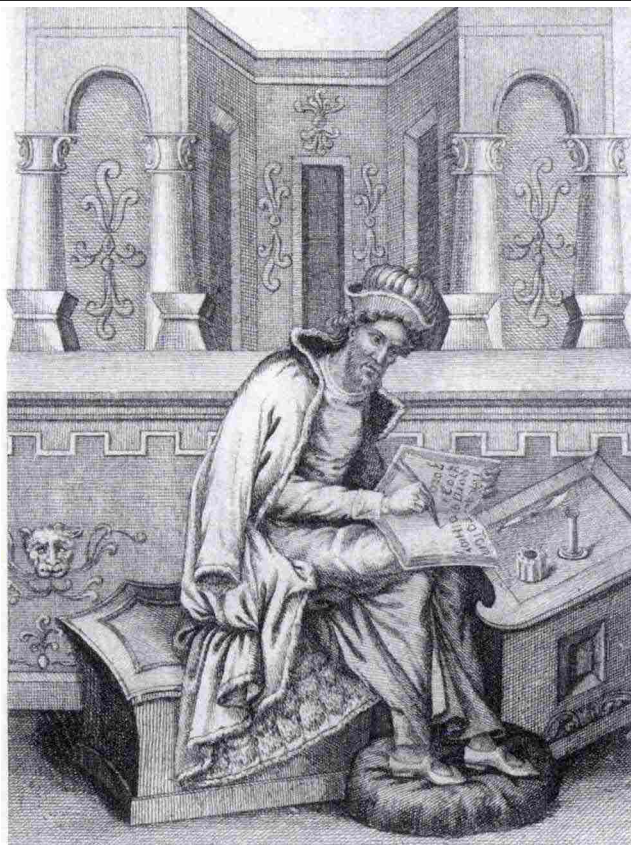
Dionigi di Alicarnasso (Alicarnasso, ca. 60 a.C. – 7 a.C.), retore e storico greco, è celebre per l'opera storiografica Antichità romane (Ῥωμαϊκή ἀρχαιολογία) in 20 libri, nella quale offre una lettura filo-ellenica della storia di Roma.

guistica, nella cultura romana sono sottolineate le componenti alloglotte dovute a migrazioni antichissime 7 .