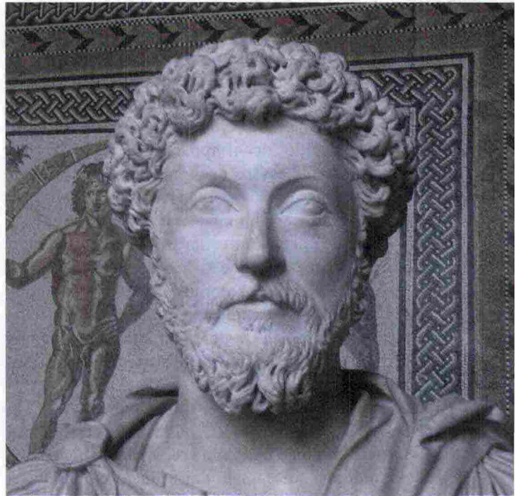
Marco Aurelio (Roma, 121 d.C. – Vindobona o Sirmio, 180 d.C.) fu imperatore romano dal 161 al 180 d.C. Indirizzato allo stoicismo dal maestro Diogene e dall'opera di Epitteto, compose in greco dodici libri di meditazioni, documento principale della sua fama letteraria e filosofica.

Fin dalla fine del IV secolo il greco si sostituisce al latino nella pratica dell'insegnamento nella scuola di diritto di Berito (odierna Beirut). Nei decenni successivi all'e-