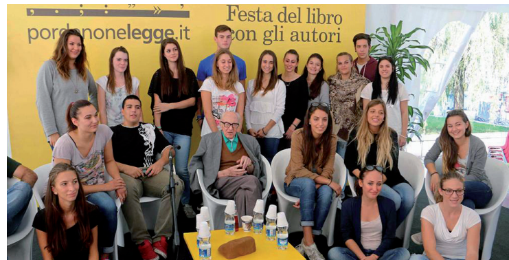
Boris Pahor con i giovani lettori a Pordenonelegge

Il libro verrà adottato in molte scuole del Nord-Est e la grande speranza di Pahor è che il testo circoli nelle scuole di tutta Italia per far comprendere ai giovani lettori gli errori della storia, i conflitti ancora aperti e come molti fatti lontani - specie della seconda guerra mondiale - non siano ancora abbastanza conosciuti. Che sia un problema ancora aperto lo scrittore ne ha dato prova durante l'incontro ricordando come alcuni suoi recenti scritti sui campi di concentramento politici (i "campi taciuti") pensati inizialmente per il "Corriere della sera", siano stati rifiutati dal quotidiano perché ritenuti scomodi.