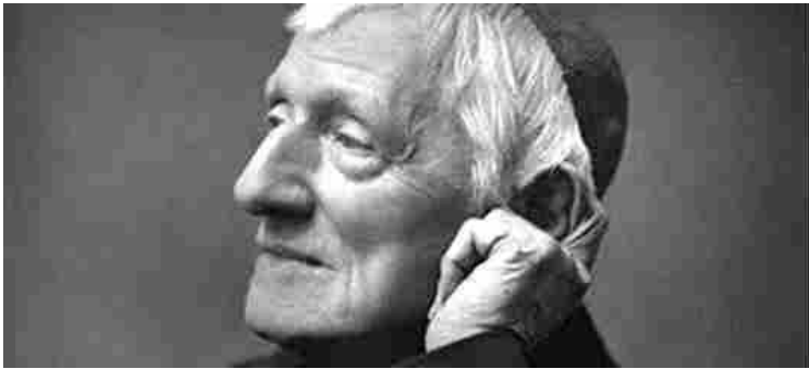
John Henry Newman

La figura di Newman è assai complessa e ricorda molto quella del Papa Emerito Benedetto XVI, che nel 2010 lo ha beatificato a Londra. Con le sue riflessioni, infatti, Newman ha riaffermato nella dottrina cattolica il “primato della coscienza”, che è centrale nel pensiero di Ratzinger , come si è visto anche nella difficile scelta di rinunciare al Pontificato nel 2013.